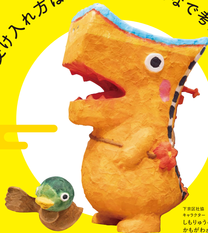
下京区社協 キャラクター しもりゆうくん かもがわさん